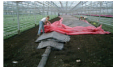
Lagedruk stomen zonder onderdruk

Omdat de wortelduizendpoot erg beweeglijk is, moet de temperatuur van de grond zo snel mogelijk stijgen. Dit voorkomt dat de wortelduizendpoot zich voor de stoom uit naar dieper gelegen lagen verplaatst. Wortelduizendpoot kan zich zo diep in de grond terug trekken dat hij onbereikbaar is voor de stoom. Daarom zal zelfs goed stomen de wortelduizendpoot niet 100% kunnen doden. Een goede structuur van de grond is bij het stomen van groot belang. Door grote kieren schiet de stoom de grond in. De indringing in grotere kluiten laat dan echter te wensen over. Hierdoor kan een onregelmatige opwarming plaats vinden. Een goede grondbewerking voor het stomen kan het regelmatig opwarmen van de grond verbeteren.