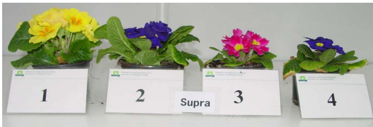
Primula acaulis 'Supra', geteeld op potgrond zonder klei, 1 = standaard EC, 2 = hoge EC, 3 = 0,1 mmol/l fosfaat, 4 = 0,05 mmol/l fosfaat

De behandeling met een hoge EC (zonder klei) gaf het beste resultaat, dit gold zowel voor 'Supra' als 'Corona'. Het resultaat voldoet echter nog niet aan het ideaalbeeld, misschien dat droger telen (dus geen eb/vloed) nog een verbetering kan geven. De andere behandelingen leverden niet de plant, zoals de afzet die graag ziet. De bovenstaande conclusie werd gedeeld door de LTO-commissie toen ze het eindresultaat van het onderzoek kwamen bekijken.