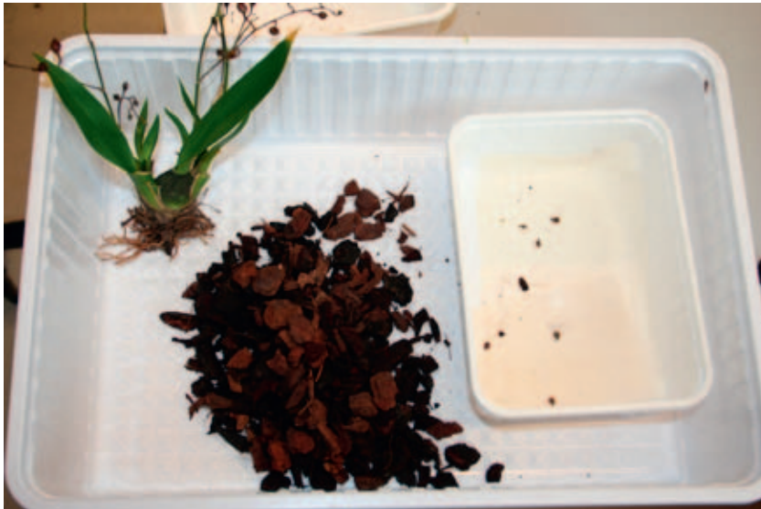
Figuur 2.3: Inzet pottenproef.

De proef werd uitgevoerd met Oncidium planten van een commerciële potorchideeënbedrijf met een infectie van de glimslak. Geïnfecteerde potten met gewas zijn naar het laboratorium gebracht. De planten zijn van het substraat gescheiden (zie Figuur 2.3) en zijn opnieuw geplant met slakken vrije bark in plastic potten (zie Figuur 2.4b). Per pot zijn er 10 slakken ingezet (volwassenen en grote juvenielen). De slakken zijn verzameld bij verschillende potorchideeëntelers, waar in de afgelopen 4 weken geen bestrijding tegen slakken was uitgevoerd. Er zijn in totaal 5 potten ingezet met 10 slakken per pot. De 5 potten zijn verdeeld over 3 behandelingen (zie Tabel 2.1). Gedurende de proef zijn de potten bewaard in een klimaatkast (80 RV; 22 °C; 14L:10D; zie Figuur 2.4a).