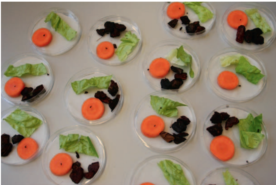
Figuur 2.1: Proefopstelling overleving in petrischalen.

De proef werd uitgevoerd in petrischalen (zie Figuur 2.1). In elk petrischaal is één slak, bark, winterpeen en sla geplaatst. De slakken zijn verzameld bij verschillende potorchideeëntelers, waar in de afgelopen 4 weken geen bestrijding tegen slakken was uitgevoerd. Bij inzet zijn de slakken verdeeld in twee groepen: volwassenen en juvenielen op basis van grootte. Er zijn in totaal 24 slakken getest, waarvan 8 volwassenen (diameter van huisjes = 3.5 mm) en 16 juvenielen (diameter van huisje < 3.5 mm). De overleving van slakken is 2 keer per week bepaald gedurende 2 weken na het inzet van de proef. Gedurende de proef zijn de petrischalen bewaard in een klimaatkast (80 RV; 22 °C; 14L:10D).