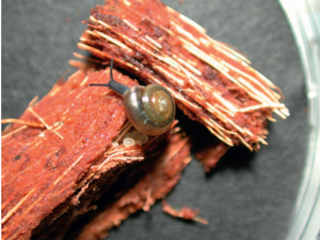
Figuur 1.1: De glimslak Zonitoides arboreus.

De huisjes van de volwassen slakken hebben een diameter van 3.5 mm en hoogte van 2-2.5 mm (zie Figuur 1.1). Het huisje is doorsichtig geelbruin van kleur.