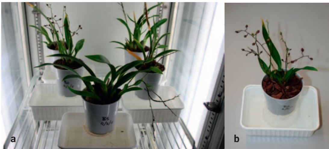
Figuur 2.4: Opzet pottenproef.