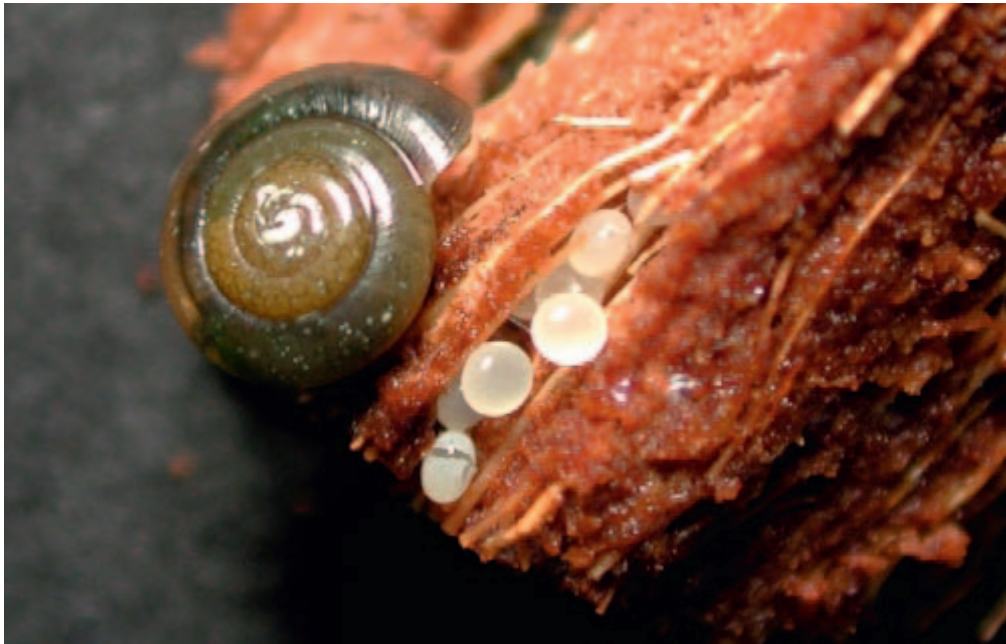
Figuur 1.2: Eieren van de glimslak Zonitoides arboreus.