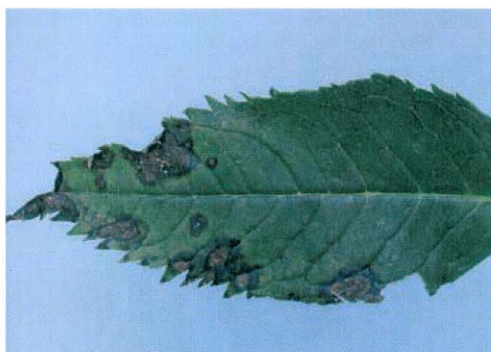
Bladvlekken in chelone veroorzaakt door botrytis.