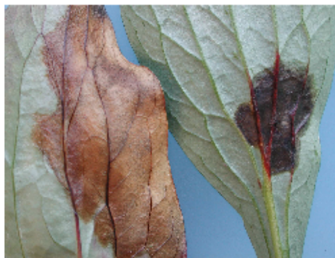
Foto 3. Pioen. Links Botrytis , rechts Cladosporium

Van de monsters uit een aantal soorten zomerbloemen zijn voor Delphinium , Campanula , Pioen en Chelone de ziekteverwekkers bepaald (zie tabel).