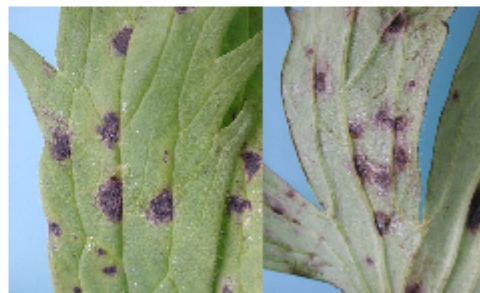
Phoma bladvlekken in Delphinium

Op het onderste blad ontstaan niet scherp begrensde, bruinzwarte bladvlekken. De vlekken zijn vaak omringd met licht vergelend bladweefsel. De bladvlekken komen zowel aan de bovenzijde als de onderzijde van het blad voor. Meerdere bladvlekken kunnen aaneen groeien, zodat grotere bladvlekken ontstaan. Uiteindelijk sterft een groot gedeelte van het blad af. Soms ontstaan ook zwartbruine vlekken op de stengels of zelfs bloemen. Relatief lagere temperaturen (15°C) en vochtige omstandigheden bevorderen het ontstaan van de schimmelziekte.