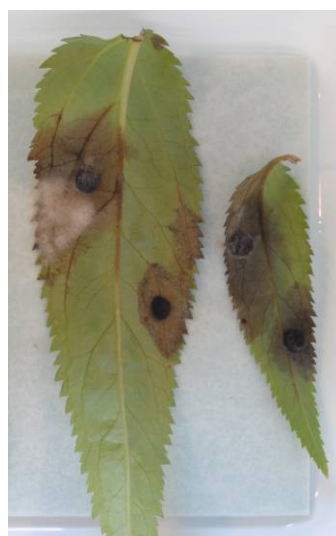
Foto 4. Bruinverkleuring Veronica in de toets. Foto 5. Aantasting Veronica in de toets.