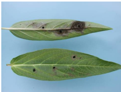
Foto 1. Aantasting van Asclepias vanuit opgebrachte ponsjes agar met schimmel. Boven: onderzijde blad, onder: bovenzijde blad.

Voor Asclepias is dus niet te zeggen wat de primaire aantaster geweest is, die de bladplekken in de monsters heeft veroorzaakt.