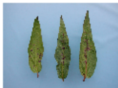
Foto 2. Bladvlekken in Asclepias