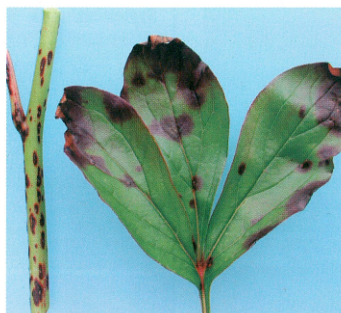
Typische blad- en stengelplekken door een aantasting van de schimmel Cladosporium paeoniae

Beide schimmels gedijen goed onder warme en vochtige omstandigheden. De beide aan-