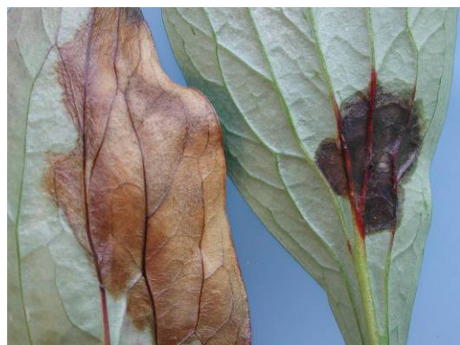
Foto 2. Links Botrytis , rechts Cladosporium .

Cladosporium wordt ook vaak op de stengels en bladstelen aangetroffen (foto 2 en 3).