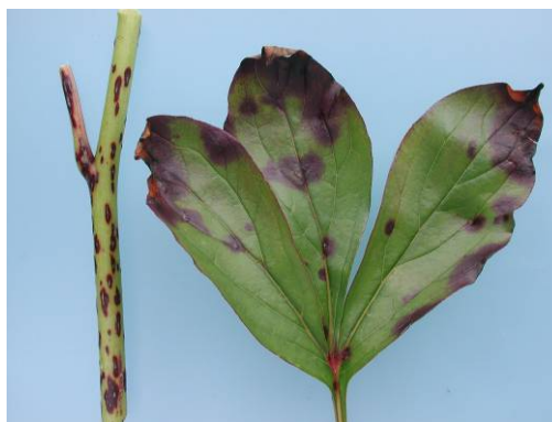
Foto 3. Cladosporium in pioen.