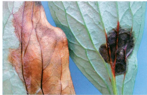
Verskil in bladplekken door Botrytis (links) en Cladosporium (rechts)

De schimmels Cladosporium paeoniae en Botrytis spp. veroorzaken verschillende soorten bladplekken in pioenroos. Dit blijkt uit een onderzoek op basis van ingestuurde bladeren van pioenroos met bladplekken. PPO zocht uit welke schimmels of bacteriën in de bladplekken aanwezig waren. Met deze kennis is het mogelijk om bladplekkenziekten gericht aan te pakken.