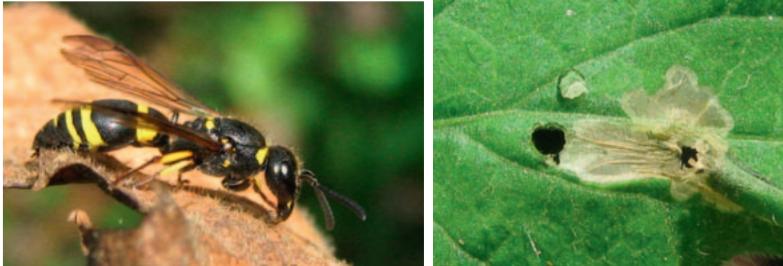
Figuur 4. en 5. Metselwespen ( Eumenidae ) jagen op rupsen, inclusief minerende soorten. Om de rups te bemachtigen wordt een gat in het blad geknaagd (rechts).

Tijdens de waarnemingen aan de tomatenplanten in Kinderdijk werden twee soorten predatoren waargenomen, een metselwesp en een roofwants. Een metselwesp (fig. 4 en 5) lijkt op het eerste gezicht wel een “limonnadewesp”, maar deze metselwespen jagen op insecten en vallen geen mensen lasig. Ze jagen ook op rupsen van minerende soorten en bijten een gat in het blad om bij de rups te komen. Deze wespen komen nooit in grote aantallen voor, zodat ze geen belangrijk effect op de aantallen van Tuta absoluta zullen hebben.