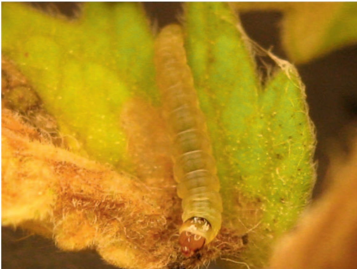
Figuur 2. Rups van Tuta absoluta buiten het blad

Tuta absoluta heeft zich in zuid Europa enorm uitgebreid en wordt op allerlei plaatsen rond de Middellandse Zee gevonden. Deze plaag komt met tomaten uit Spanje en Italië in Nederland binnen en omdat de tomaten hier worden verpakt voor de handel, bestaat steeds de mogelijkheid dat de mot zich vestigt in de Nederlandse tomatenteelt. Het doel van de voortzetting van het onderzoek is het veiligstellen van de geïntegreerde gewasbescherming in de tomatenteelt. De teelt is gebaat bij de mogelijkheid om op korte termijn selectieve middelen toe te kunnen passen en op langere termijn natuurlijke vijanden.