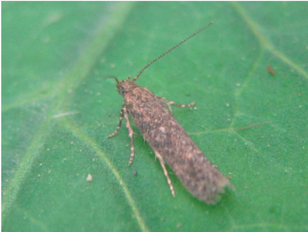
Figuur 3. De mot Tuta absoluta

De kweek vond in 2010 op dezelfde wijze en met dezelfde voorzorgen plaats als in 2009. Kooien met tomatenplanten stonden in een kasruimte met gaas voor de luchtramen en deze ruimte was alleen toegankelijk via twee corridors. Geregeld werden schone tomatenplanten toegevoegd en oude planten met mijnen werden pas afgevoerd, als er geen motten (fig. 3) meer uit het oude plantmateriaal kwamen.