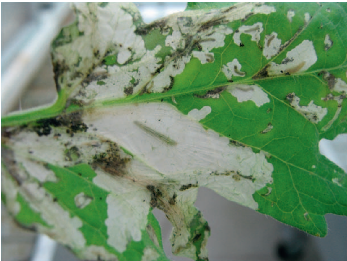
Figuur 1. Mijnen met rupsen van Tuta absoluta

Het optreden van Tuta absoluta kan worden vastgesteld doormiddel van feromoonvallen. Maar omdat op deze wijze alleen mannetjes worden gevangen, is het ook belangrijk om te letten op aantasting in het gewas (fig. 1). De jonge mijnen zijn vrij moeilijk van mijnen van mineervliegen te onderscheiden. In de oude mijnen van Tuta absoluta zijn de uitwerpselen gemakkelijk te zien. Voor de praktijk blijft het belangrijk de aantallen van de roofwants Macrolophus zo snel mogelijk op een hoog niveau te krijgen.