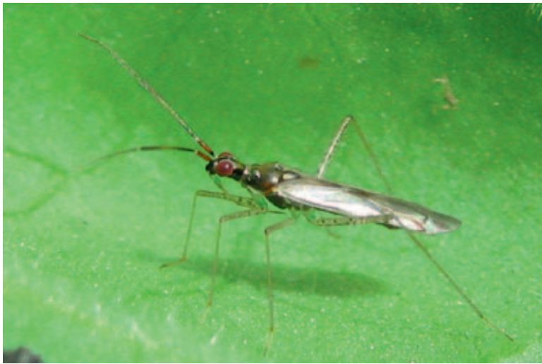
Figuur 6. . De roofwants Dicyphus errans komt in Nederland buiten spontaan op tomaat voor.