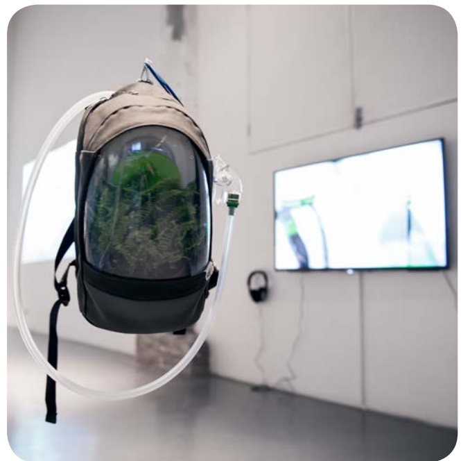
Het eerste prototype van iGreen met een film over de werking, TETEM

Afgelopen jaar is het ontwerp met marktpartijen verfijnd. Uit onderzoek van Fytagoras blijkt dat ventilatie de luchtzuiverende werking versterkt en dat varens het meest geschikt zijn (meeste zuivering, compact en robuust). Binnenkort start verder gebruikersonderzoek en een marktscan in Azië. Het eerste prototype van iGreen met een film over de werking was te zien in TETEM (in Enschede) met meer dan 1500 bezoekers. De nieuwste prototype is te zien op de Dutch Design Week (in oktober, in Eindhoven).