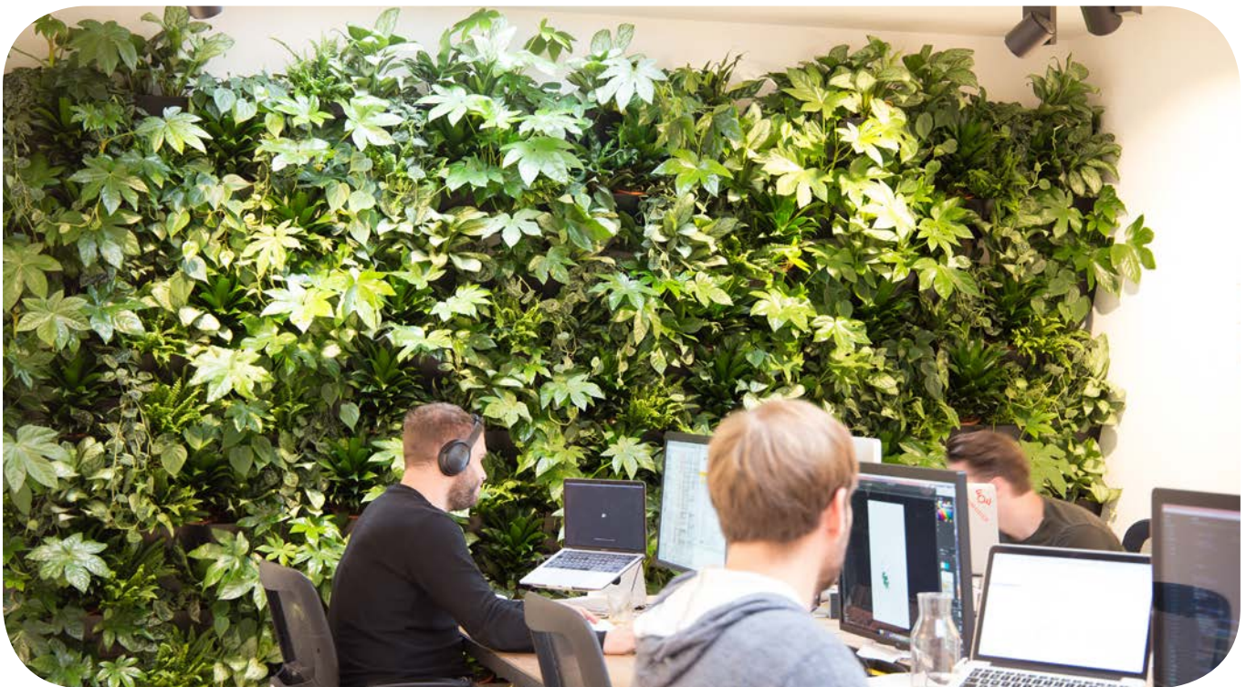
Het Cloudgarden systeem bestaat uit een sensor die de luchtkwaliteit meet, een ventilator met ingebouwde verlichting en een groene wand (cloudgarden.nl)

de ventilatoren meer lucht langs de planten in de groene wanden blazen. Dat zorgt voor versnelde afbraak van de ongewenste vluchtige organische stoffen (VOS) zoals formaldehyde, toluen en benzeen. De eerste klant voor het nieuwe systeem is Lama Lama, een creatief bureau in het centrum van Amsterdam dat apps en games ontwikkelt. De circulaire plantenwand springt er in de moderne werkomgeving duidelijk uit en geeft ieder een vitaal gevoel.