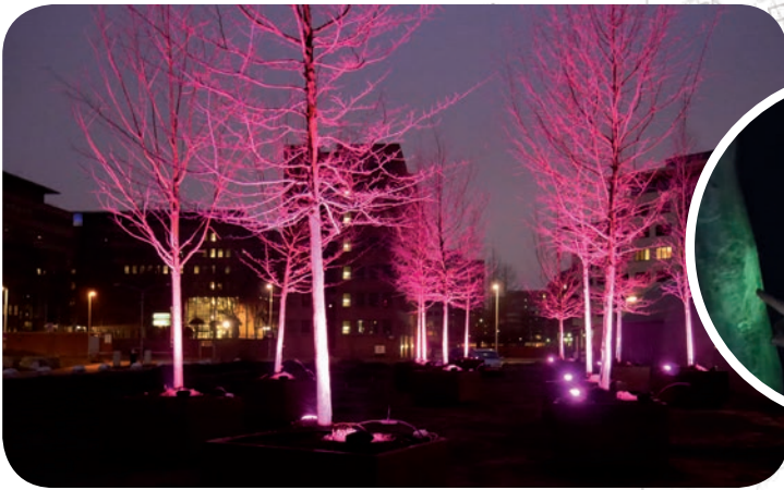
'Glowing trees' die met energiezuinige ledverlichting kort opladen