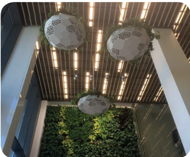
Vergroening winkelcentrum De Eggert in Purmerend

SIGN werkte samen met de beursgenoteerde vastgoedonderneming Wereldhave concepten uit voor vergroening van winkelcentra. Vergroening van winkelcentra verhoogt de aantrekkingskracht voor de consument; bezoekers verblijven er langer en spenderen meer geld. Groen past bij de trend van een prettige winkelervaring, waardoor mensen liever in het winkelcentrum hun geld uitgeven dan online. In winkelcentrum De Eggert in Purmerend heeft SIGN onderzocht hoe de groene beleving kan worden bevorderd. Wereldhave investeerde in een grote groene wand langs de roltrap en met hangende groensystemen zijn proeven uitgevoerd om bewegend licht in het gebouw te brengen. Een ander concept is om bloemenwinkels tegen lage kosten extra uitstalruimte te geven, die ze uiteraard met planten moeten invullen. Het winkelcentrum vergroent zo zonder veel kosten en alle winkeliers hebben er voordeel van.