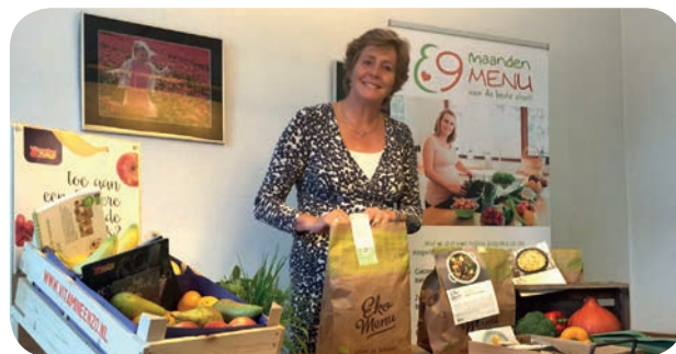
Een gezond aanbod in de verloskundige praktijk (i.s.m. Vitamine&Zo)

Pilot 1: het project '9 maanden menu' voor zwangere vrouwen gebruikt een indringende verandering in het leven, de zwangerschap, als trigger om duurzaam gezonder te gaan eten, voor zowel moeder als kind. In het project zijn specifieke recepten, tips en voedingsconcepten (o.a. bio maaltijdbox) voor zwangeren ontwikkeld met voldoende groenten en fruit. In samenwerking met zorgintermediairs (verloskundigen en diëtisten) verkent de pilot ook welke factoren een rol spelen bij de acceptatie van een gepersonaliseerde aanbod.